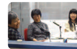
実行委員会メンバーがFM放送に出演