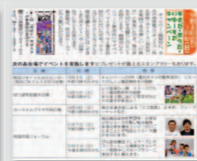
▲市報による情報告知