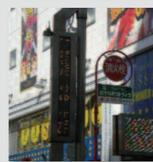
▲市の電光掲示板による広報

キャンペーン情報とともに、マイボトルを使えるコーヒーショップ、リユース容器を使っているお弁当屋さん、リユースびん入りの清酒などの情報を紹介。さらに市内の大学の学園祭情報も告知しました。